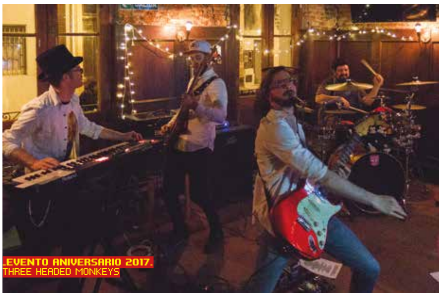
EVENTO ANIVERSARIO 2017. THREE HEADED MONKEYS

A través de nuestros 12 números han pasado decenas de desarrolladores, músicos, programadores y diseñadores que trabajan en videojuegos hoy y que nos ayudan a entender el estado actual de la industria local. Y a lo largo de varios eventos, como organizadores y como invitados, hemos podido acercar a los curiosos algunas de estas historias y participar del debate sobre el rol de los videojuegos en nuestra tradición cultural.