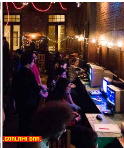
GORI AMI BAR